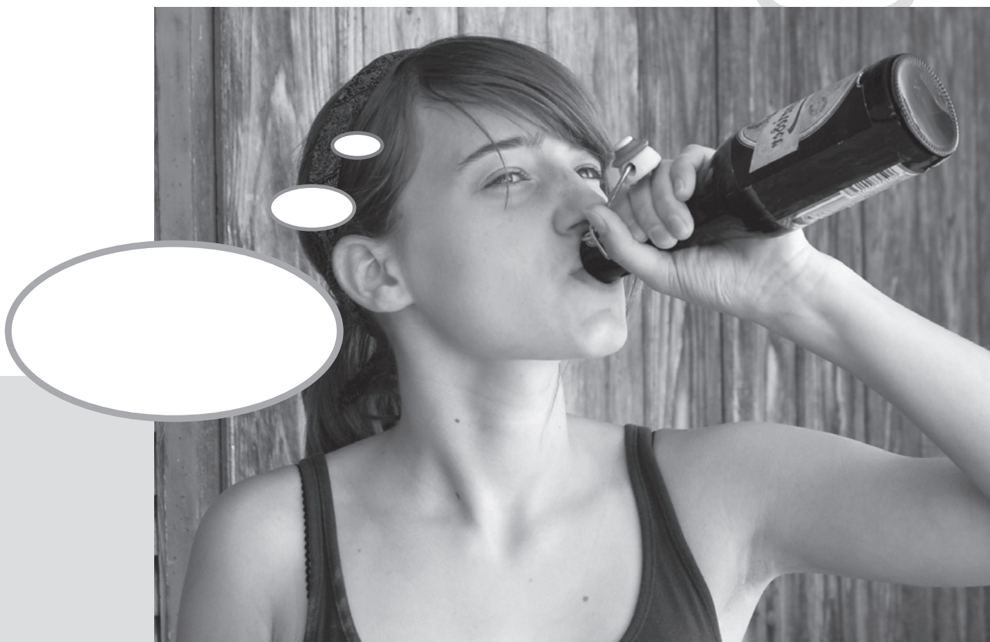
Immagine riprodotta con una ragazza che manifestamente non consuma bevande alcoliche.

Cosa potrebbe pensare questa ragazza che beve? Cosa potrebbe sentire?